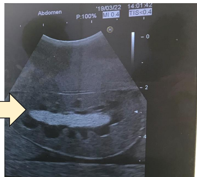
タナック製腎臓ファントムのエコー写真